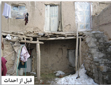
قبل از احداث

مؤسسه بر این باور است که تحویل هزارمین خانه به مددجویان نیازمند، گامی کوچک در رفع مشکلات و معضلات مسکن ایشان می باشد و برای بهبود و تأمین مسکن سایر نیازمندان شهرمان، گام های بزرگتری باید برداشته شود. گام هایی که با عنایت خداوند متعال و با همت شما خیرین بزرگوار در آینده برداشته خواهد شد. تحویل هزارمین خانه، مقدمه ای است برای رسیدن به هدفی بزرگ تر و آغازی است دوباره با همتی والاتر.