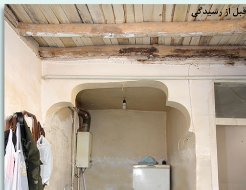
قبل از رسیدگی

◀ احداث حمام در حیاط ، لوله کشی و کاشیکاری ، سفیدکاری داخل اتاقها ، تعویض درب و پنجره