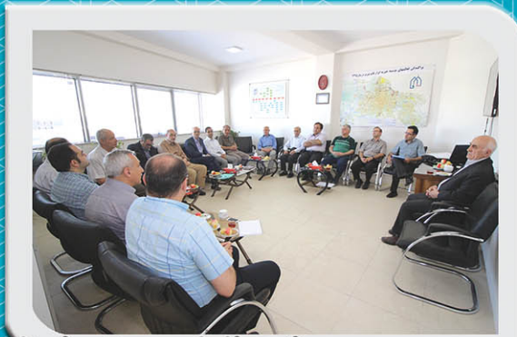
مجمع عمومی و فوق العاده هیئت امنا