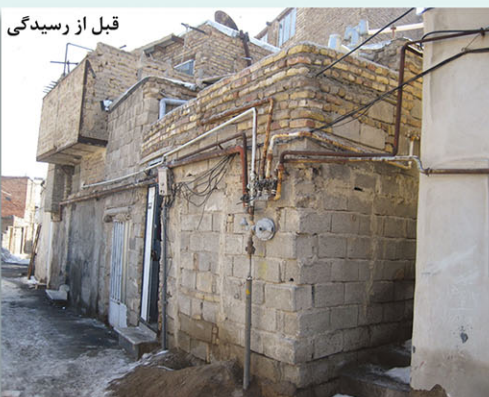
قبل از رسیدگی

◀ کاشی کاری حمام و دستشویی و آشپزخانه ، کفسازی ، گچ کاری نصب درب سرویس ها .