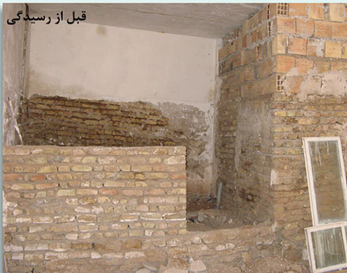
قبل از رسیدگی