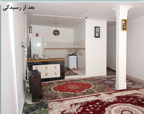
بعد از رسیدگی