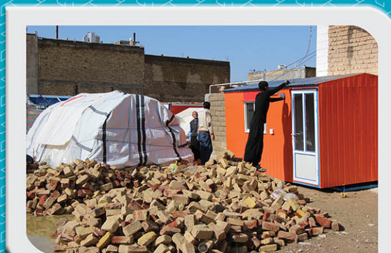
تحويل کانتکس به مردم زلزله زده کرمانشاه