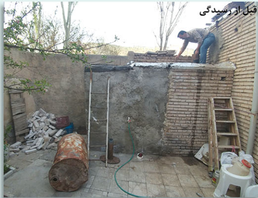
قبل از رسیدگی