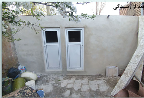
بعد از رسیدگی