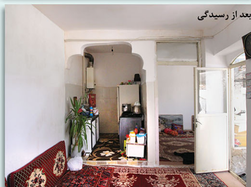
بعد از رسیدگی