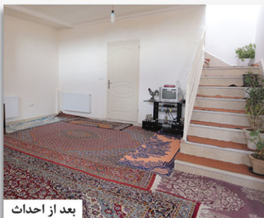
بعد از احداث