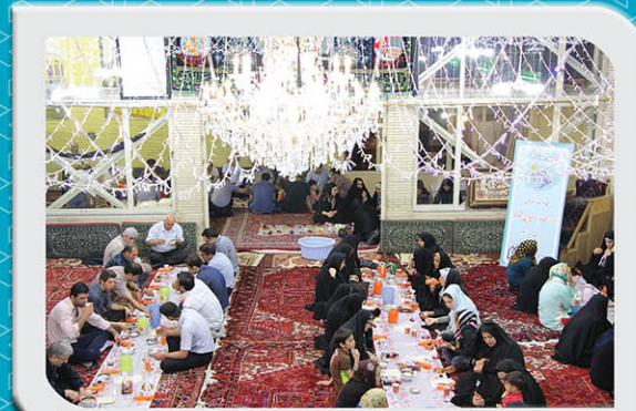
مراسم افطاری خانواده های ابرار قائم