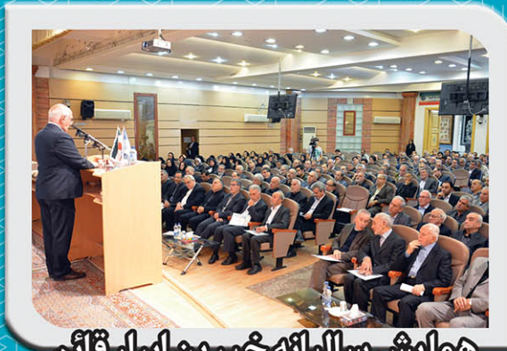
همایش سالیانه خیرین ابرار قائم