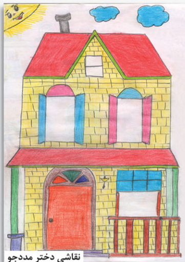
نقاشی دختر مددجو