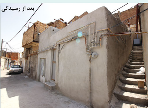
بعد از رسیدگی