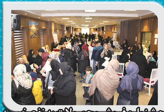
جشنواره فروش محصولات به نفع خیریه